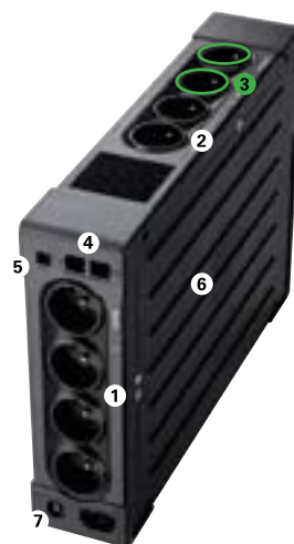
Eaton Ellipse PRO 1200/1600