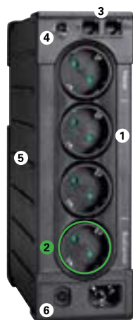
Eaton Ellipse PRO 650/850