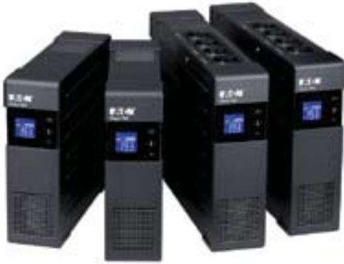
Gamme Ellipse PRO